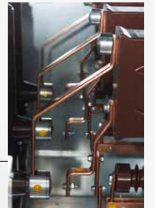
Güçlendirilmiş alan düzenleyiciler ile gerilim dalgalanmaları ve nemli hava şartlarında daha iyi izolasyon özelliği.