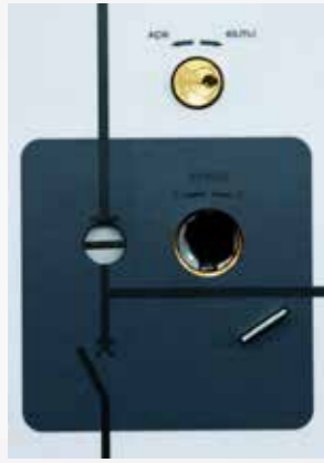
Ayırıcı ve Kesici arasındaki mekanik kilit sistemi ile güvenli manevra yapmayı sağlama ve hat üzerindeki yapılan çalışmalarda yanlış manevraları önleyici kilit sistemi.