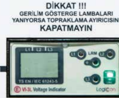
Kontaklı gerilim gösterge indikatörü sayesinde hücrenin enerjili olup olmadığını scada sisteminden takip edebilme imkanı.