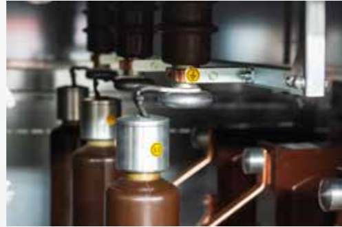
Hücre önündeki gözetleme pencerelerinden toprak bıçaklarının pozisyonunu görebilme özelliği ile maksimum operatör güvenliği.