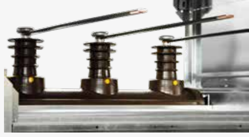
30 X 10mm toza karşı izoleli ana bara seti ve alan düzenleyiciler.