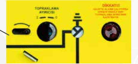
Girişte enerji var iken toprak bıçağına müdahale hareketinde ışıklı ve sesli uyarı sistemi ile toprak bıçağını enerji üzerine kapatmayı uyararak operatör dostu ikaz sistemi.