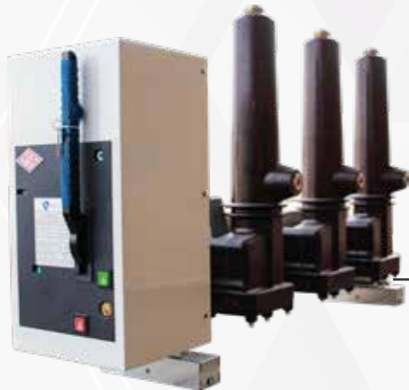
M2 E2 C2 (mekanik 10.000 açma-kapama) sınıfında SF6 gazlı kesici kullanılmaktadır.. Opsiyonel vakum kesici de kullanılabilir.