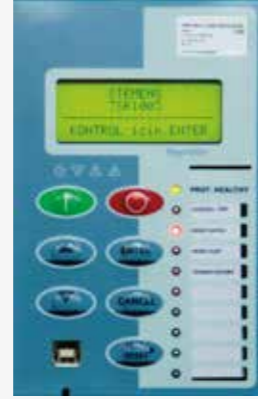
Müşterilerimizin istemiş olduğu marka ve modeldeki aşırı akım, kısa devre koruma röle montajının yapılabilme imkanı