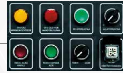
Operatör dostu uzaktan kumanda soketi, butonlar ve sinyal lambaları.