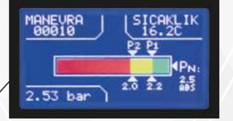
Çift kontaklı dijital manometrenin geniş ekranı sayesinde gaz basınç kontrolü ile birlikte SF6 gaz sıcaklığı ve ayırıcının manevra sayısını takip edebilme olanağı.